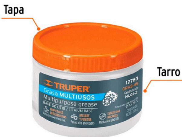
Contenido 450 g